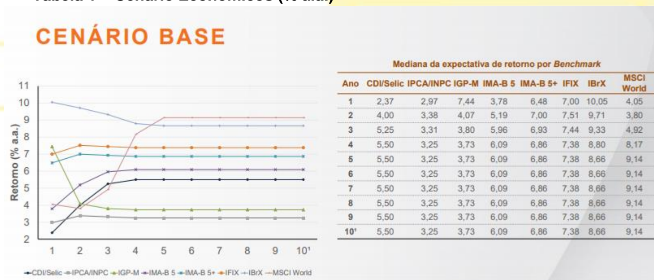
Tabela 1 – Cenário Econômicos (% a.a.)