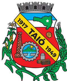
Brasão com tagline horizontal