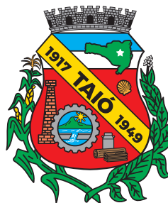
Brasão com tagline vertical

Existem 2 configurações diferentes: brasão com tagline vertical e brasão com tagline horizontal. A escolha da opção adequada ao uso vem da análise de cada necessidade.